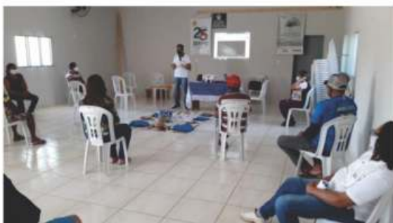
Foto 07: GRH em São José do Seridó

Durante todo o curso foram servidas as refeições: café, almoço e lanche. Também foram respeitados todos os protocolos sanitários para prevenção da COVID-19, como distanciamento das cadeiras, disponibilização de álcool em gel, água e sabão em todos os locais onde foram realizadas as capacitações.