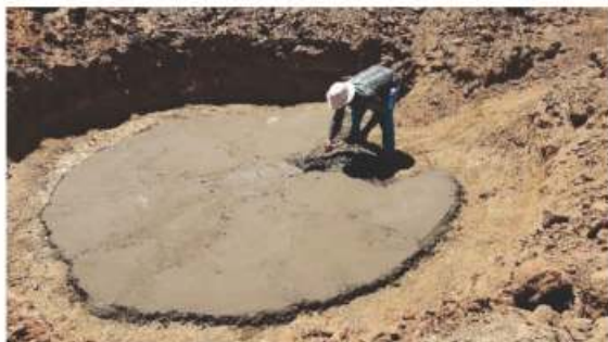
Foto 17: Construção do piso