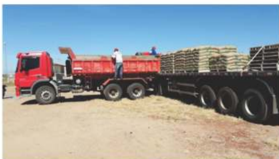
Foto 13: Distribuição do cimento