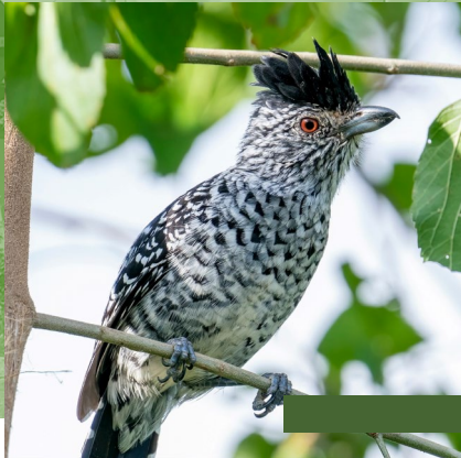
Comunidade da Jurema, Amontada (CE)

1.4. Ministério de Desenvolvimento Agrário e Agricultura Familiar – Responsável pelas políticas públicas voltadas à agricultura familiar, tem papel-chave na garantia de que o investimento realizado nas últimas duas décadas neste setor esteja harmonizado com a política energética brasileira.